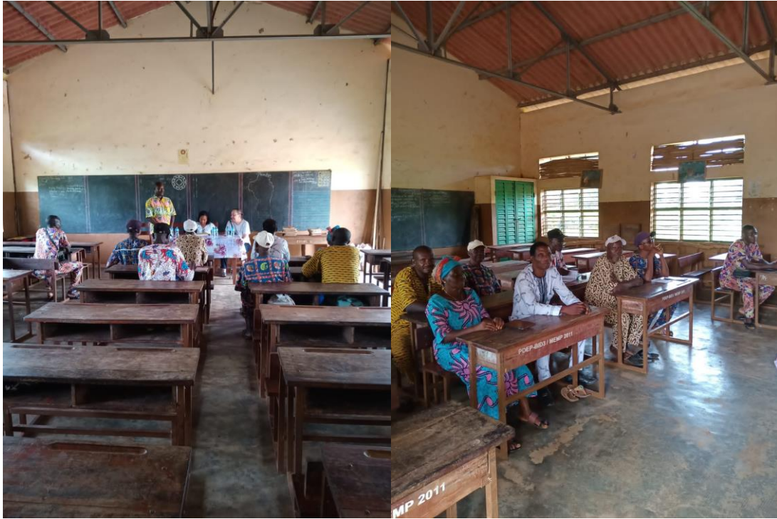
Réunion à l'EPP GAHOUE