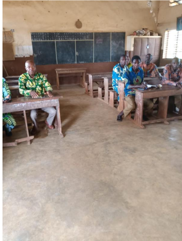
Réunion à DRE