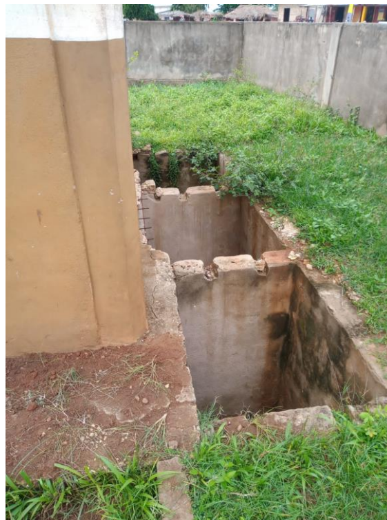
L'effondrement des latrines de DRE