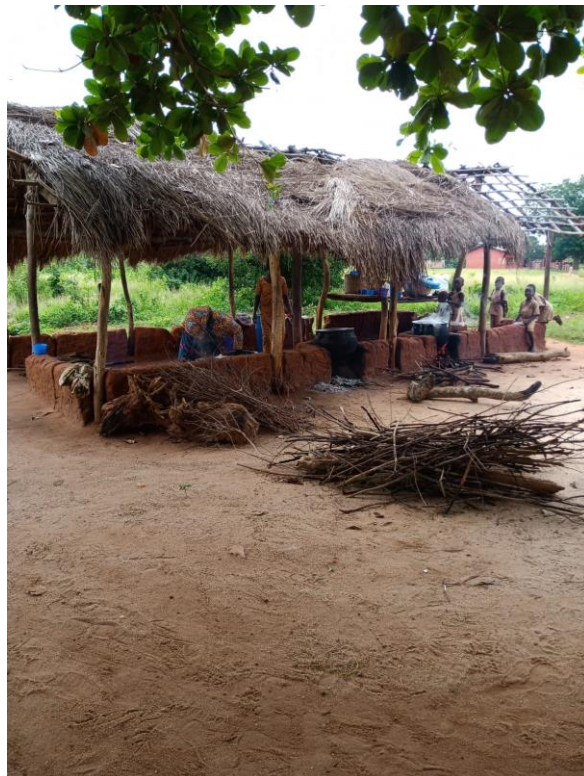
CANTINE EPP GAHOUE